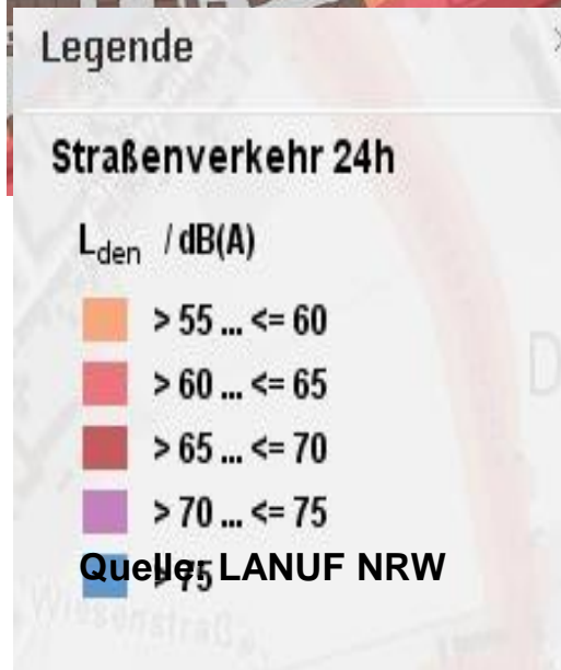
Dellbrück Lärm nachts